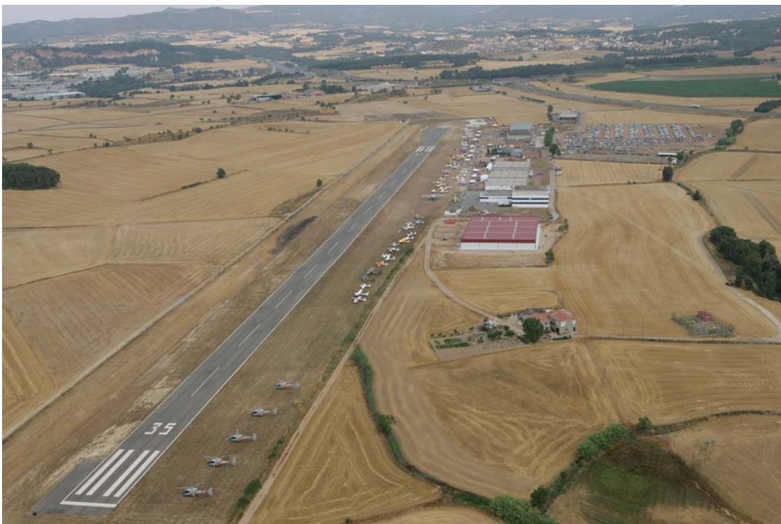
Imatge actual de l'aeròdrom

Actualment, l'aeròdrom té una superfície de 33,83 hectàrees i una pista de vol de 883 metres de llargada i 18 metres d'amplada. La superfície està asfaltada i té senyalització horitzontal. També té una pista paral·lela de terra al costat est de la pista principal, que s'utilitza de carrer de rodada i de pista de vols per a aeronaus lleugeres.